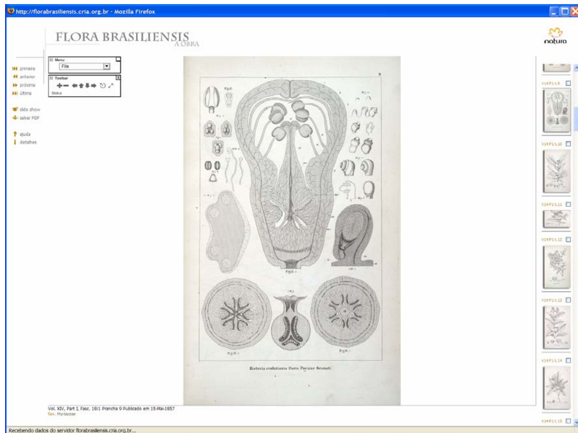
Página de visualização das imagens

Algumas poucas modificações foram feitas na interface de visualização on-line das pranchas para permitir que as imagens de referência das pranchas selecionadas ( thumbnails ) fizessem parte da tela, facilitando a navegação do usuário.